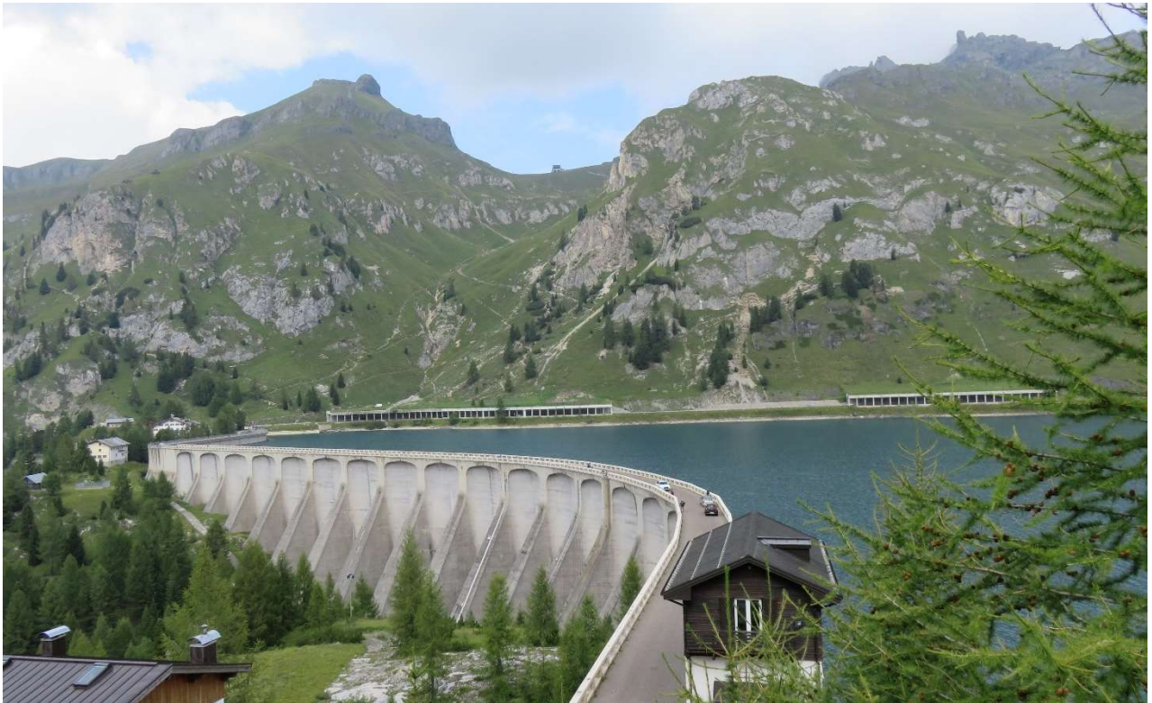
1. Etappenziel: Fedaia See

Aufstieg von Penia (1556 m) zur Rifugio Castiglioni Marmolada (2058m) am Fedaia See (8,2 km, Gehzeit 2 ½ - 3 Stunden, Aufstieg ca. 500 hm, Schwierigkeit: leicht)