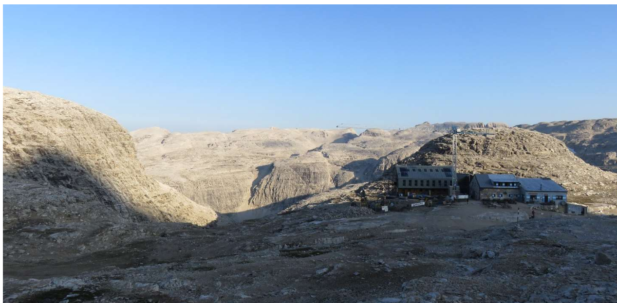
2. Etappenziel: Rifugio Boé (2873m)

Höhenprofil: 2. Tagesetappe (ohne Piz Boé)