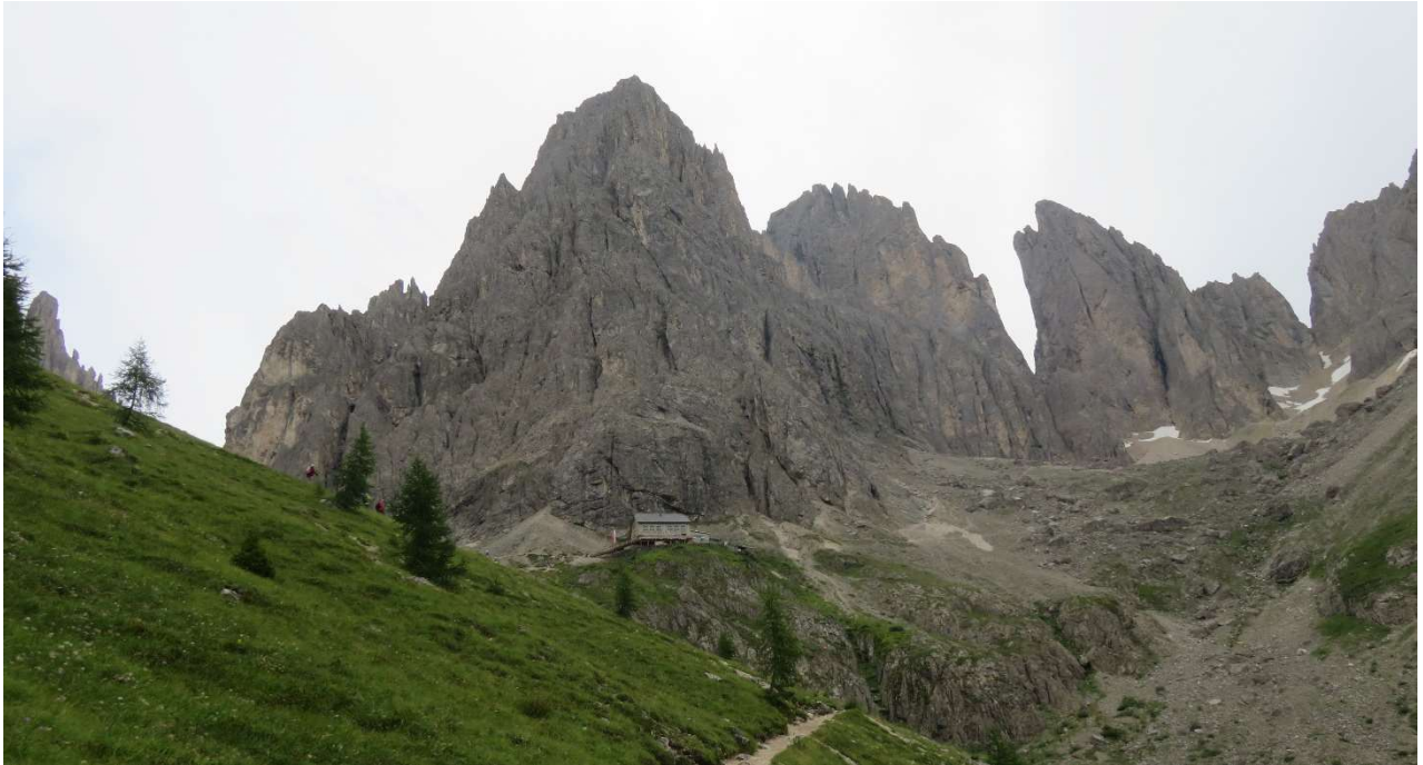
3. Etappenziel: Langkofelhütte (2256m)

(ca. 13,0 km, Gehzeit 7 -7 ½ Stunden, Aufstieg ca. 850 hm, Abstieg ca. 1450 hm, Schwierigkeit: mittel)