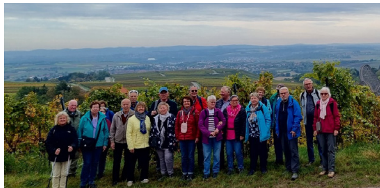
Seniorenausfahrt ins Weingebiet Zabergäu