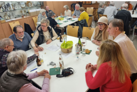
Mutscheln im Gemeindehaus 2023

Am 8. März 2024 laden wir zu einem Puppentheater für Kinder und Eltern ein, und am 11. Oktober gibt es einen Reisevortrag über Madeira.