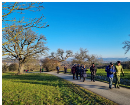
60 plus Wanderungen Besinnungsweg Neckarhausen 2023, Schönbusch 2023