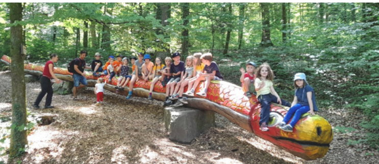
Beim Familienwochenende 2023