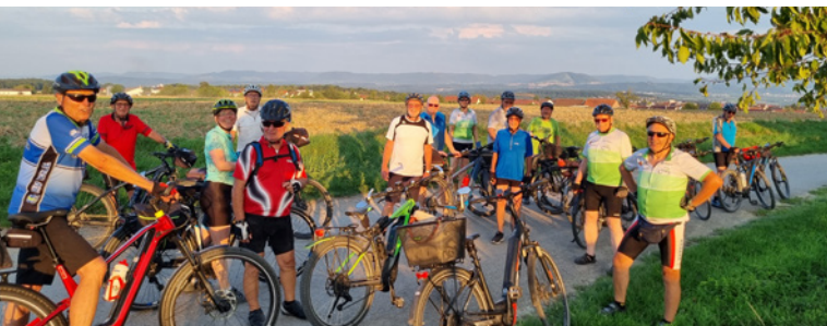
Kurzer Foto-Stopp oberhalb von Rübgarten