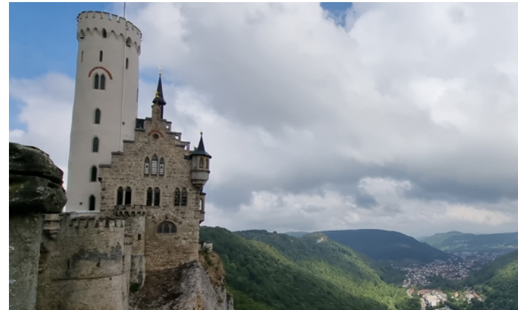
Blick von Schloss Lichtenstein ins Tal