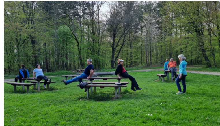
Bei der Gesundheitswanderung im April 2023

Die Termine für 2024 sind 19. April, 28. Juni, 27. September