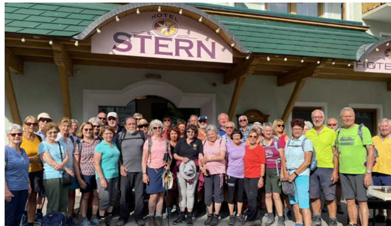
Bergfrühling im Zugspitzgebiet: Die Wandergruppe 2023 vor ihrem Hotel