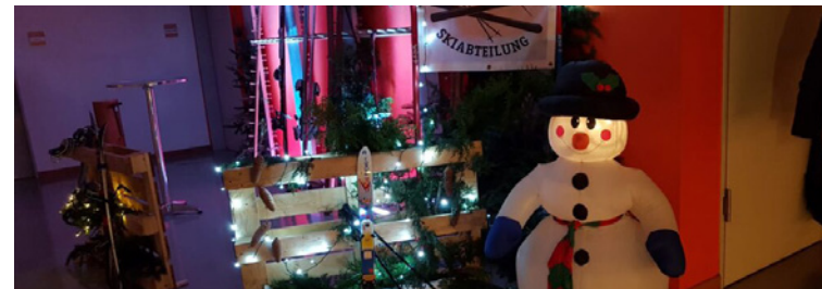
Skiausfahrt nach Sterzing

Näheres zu obigen Veranstaltungen finden Sie im separaten Veranstaltungsplan der Skiabteilung oder auf der Homepage: www.sav-wannweil.de/skiabteilung