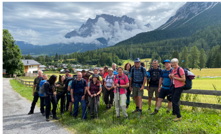
Die Hüttengruppe auf einer Wanderung