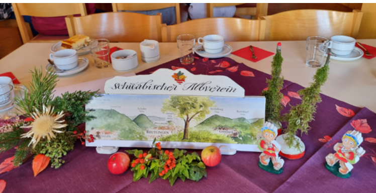
Festliche Tischdeko beim Abschlussnachmittag der Senioren-Busausfahrten 2023

Inwieweit Teilnehmer an Wanderungen, Ausfahrten und sonstigen Unternehmungen des Schwäbischen Albvereins sowie dessen Mitglieder und aktiv Tätigen unfall-, haftpflicht- und kaskoversichert sind bzw. auf eigene Gefahr teilnehmen oder mitwirken, kann dem Versicherungsmerkblatt des Schwäbischen Albvereins entnommen werden. Dieses ist auch auf der Homepage unserer Ortsgruppe unter dem Stichwort „Veranstaltungen/Wanderplan 2024“ zu finden. Gerne lassen wir Ihnen einen Ausdruck zukommen. Sprechen Sie dazu unseren Vorstand an.