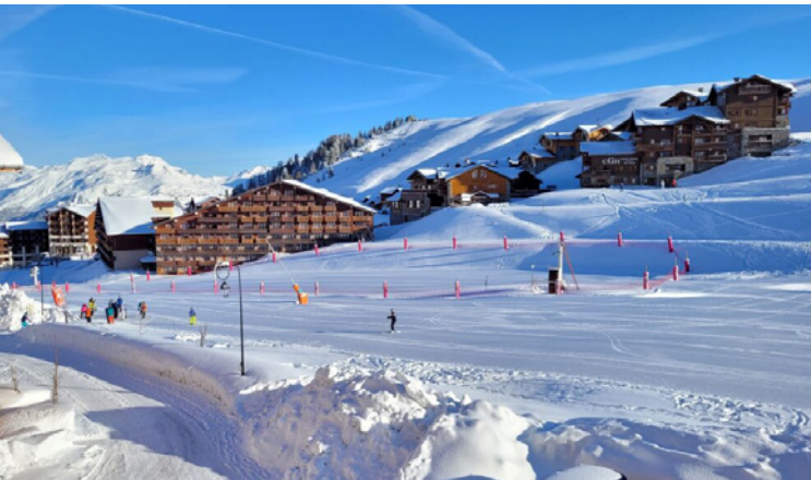
Skiwoche in Frankreich